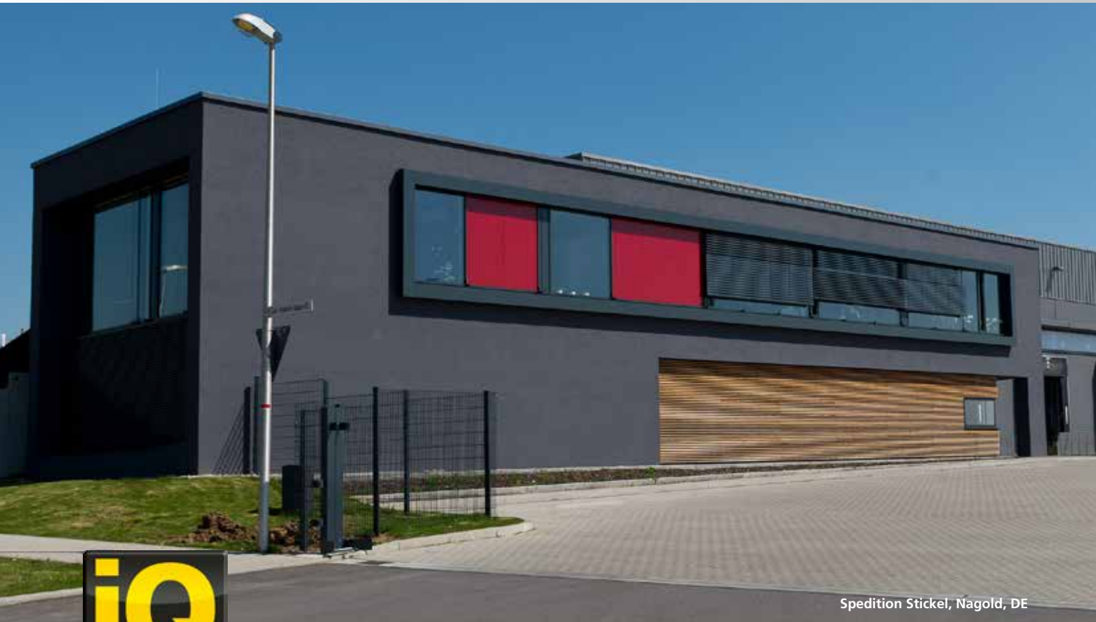
Spedition Stickel, Nagold, DE