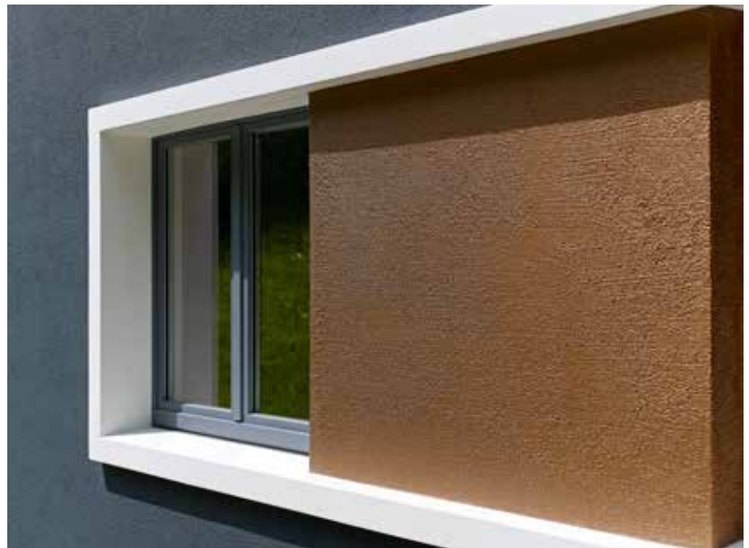
Pier 78, Essen, DE

Mit StoColor X-black sind farbliche Begrenzungen praktisch aufgehoben. Auch kräftig getönte und schwarze Fassadenoberflächen sind problemlos möglich. Die Farbe auf Reinacrylatbasis ist in allen Farbtönen des StoColor Systems erhältlich und auf Anfrage in zahlreichen weiteren. Im Zusammenspiel mit dem Wärmedämm-Verbundsystem StoTherm Classic® sind sogar Hellbezugswerte < 10 möglich.